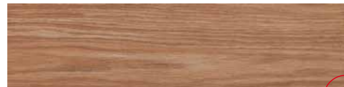
LG 9 Grip 15x60 6"x24" 079

In fase di posa si consiglia una sfalsatura massima di 15 cm Do not offset brick pattern by more than 15 cm Bei versetzter Verlegung wird ein Versatz von maximal 15 cm empfohlen En phase de pose on conseille un décalage de 15 cm au maximum