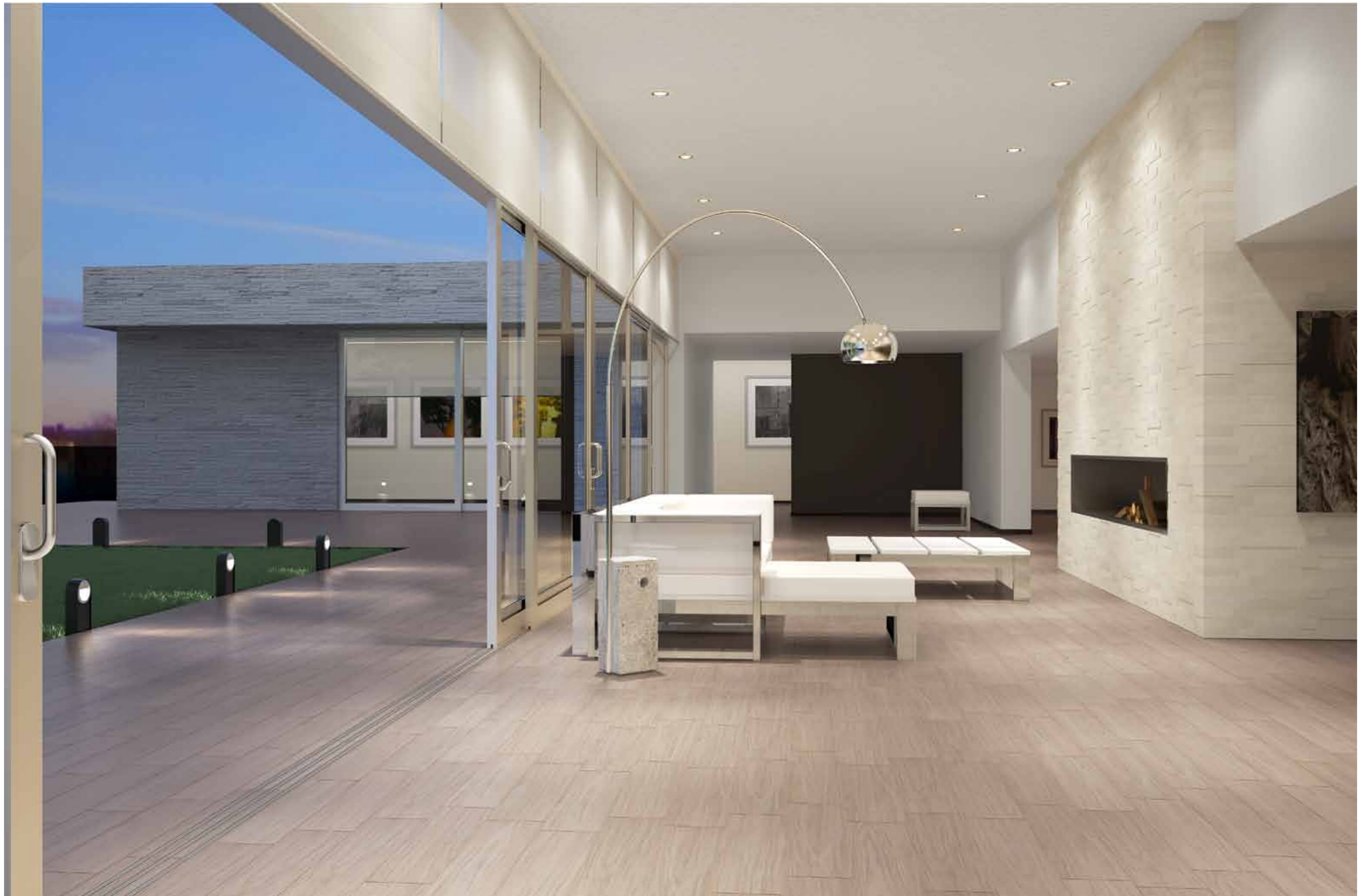
Outside: LG 5