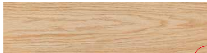
LG 1 Grip 15x60 6"x24" 079

In fase di posa si consiglia una sfalsatura massima di 15 cm Do not offset brick pattern by more than 15 cm Bei versetzter Verlegung wird ein Versatz von maximal 15 cm empfohlen En phase de pose on conseille un décalage de 15 cm au maximum