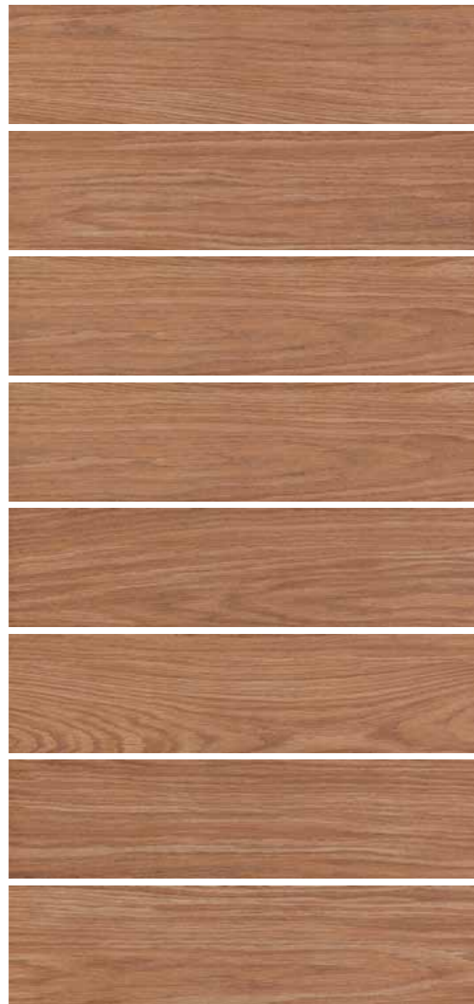
LF 9 15x60 6"x24" 073

In fase di posa si consiglia una sfalsatura massima di 15 cm Do not offset brick pattern by more than 15 cm Bei versetzter Verlegung wird ein Versatz von maximal 15 cm empfohlen En phase de pose on conseille un décalage de 15 cm au maximum