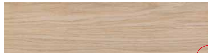
LG 5 Grip 15x60 6"x24" 079

In fase di posa si consiglia una sfalsatura massima di 15 cm Do not offset brick pattern by more than 15 cm Bei versetzter Verlegung wird ein Versatz von maximal 15 cm empfohlen En phase de pose on conseille un décalage de 15 cm au maximum