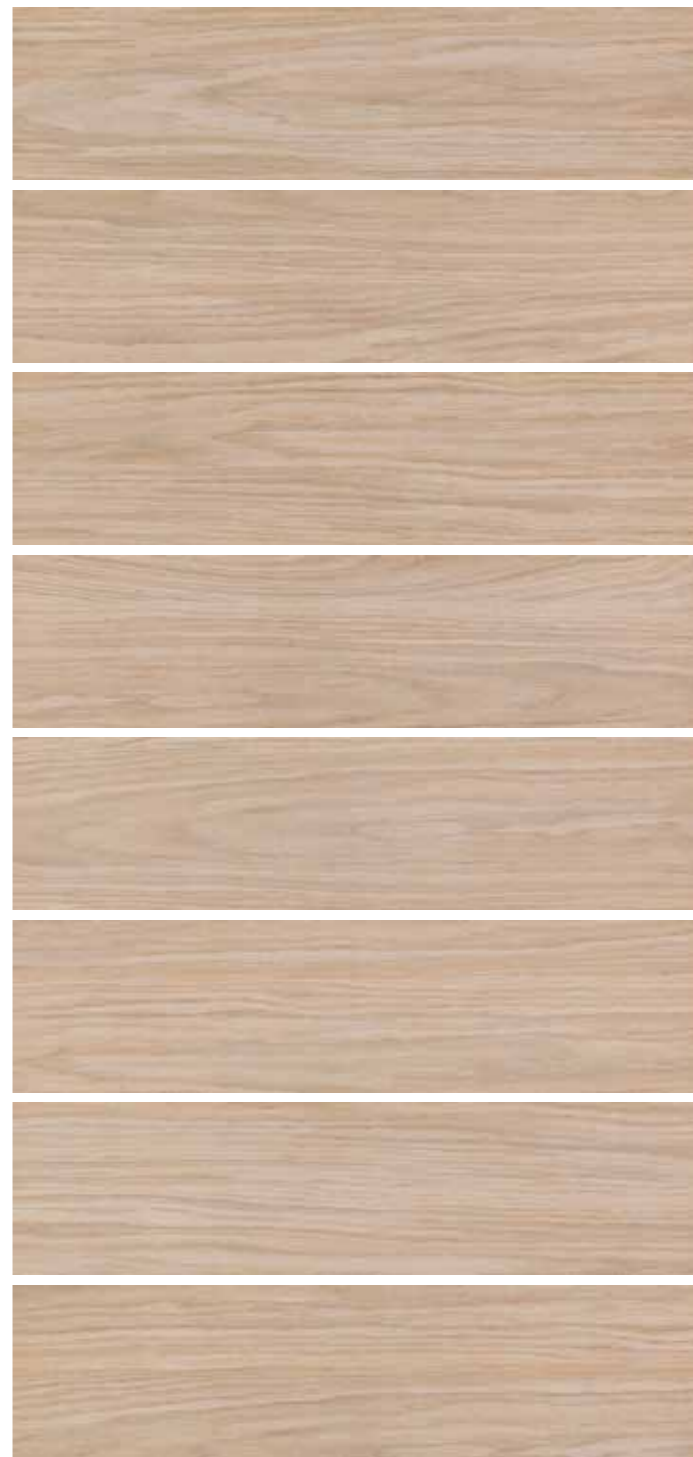
LF 5 15x60 6"x24" 073

In fase di posa si consiglia una sfalsatura massima di 15 cm Do not offset brick pattern by more than 15 cm Bei versetzter Verlegung wird ein Versatz von maximal 15 cm empfohlen En phase de pose on conseille un décalage de 15 cm au maximum