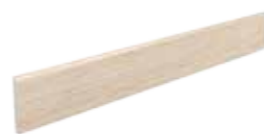
Battiscopa / LF 10 7,5x60 3"x24" 020

Pezzi Speciali Special Pieces • Formteile • Pièces spéciales