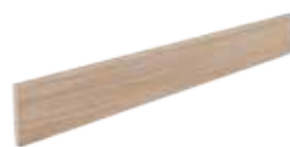
Battiscopa / LF 5 7,5x60 3"x24" 020

Pezzi Speciali Special Pieces • Formteile • Pièces spéciales