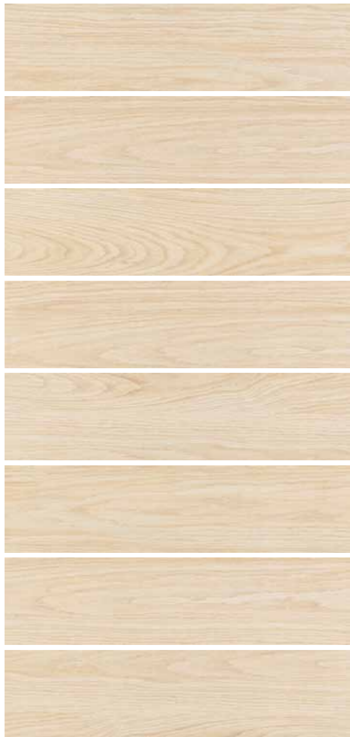
LF 10 15x60 6"x24" 073

In fase di posa si consiglia una sfalsatura massima di 15 cm Do not offset brick pattern by more than 15 cm Bei versetzter Verlegung wird ein Versatz von maximal 15 cm empfohlen En phase de pose on conseille un décalage de 15 cm au maximum