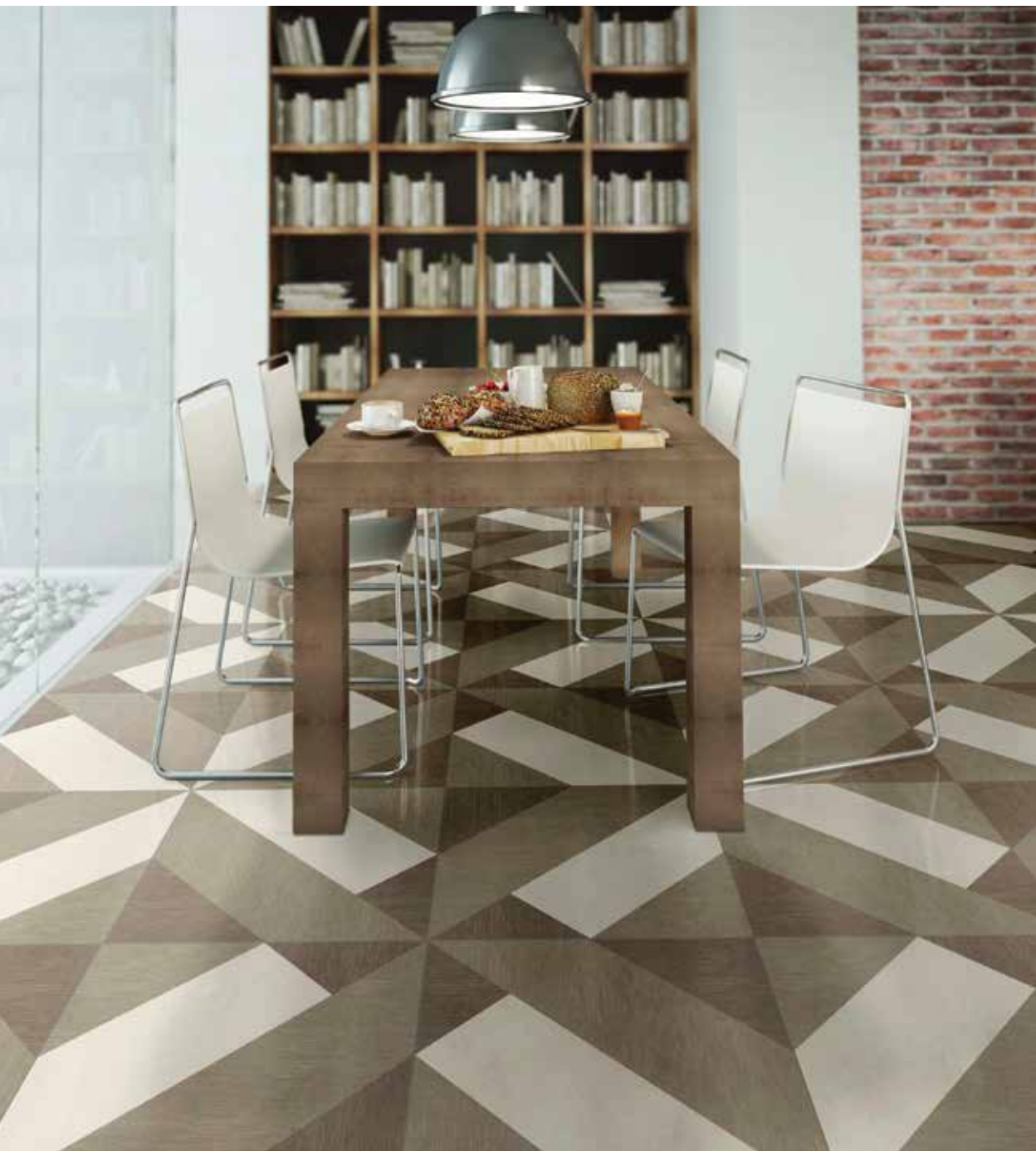
Giò #03 Beige 60x60 cm / 24"x24" Solution 4