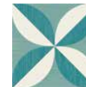
Gio #05 20x20 cm / 8"x8" Turchese