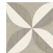
Gio #05 20x20 cm / 8"x8" Tortora