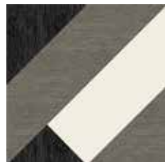
Gio #03 60x60 cm / 24"x24" Nero