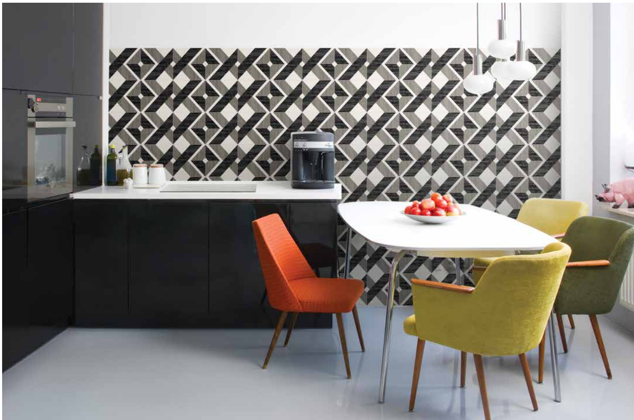
Giò #04 Nero 20x20 cm / 8"x 8" Solution 2