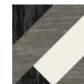
Gio #06 20x20 cm / 8"x8" Nero