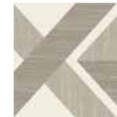
Gio #04 20x20 cm / 8"x8" Tortora