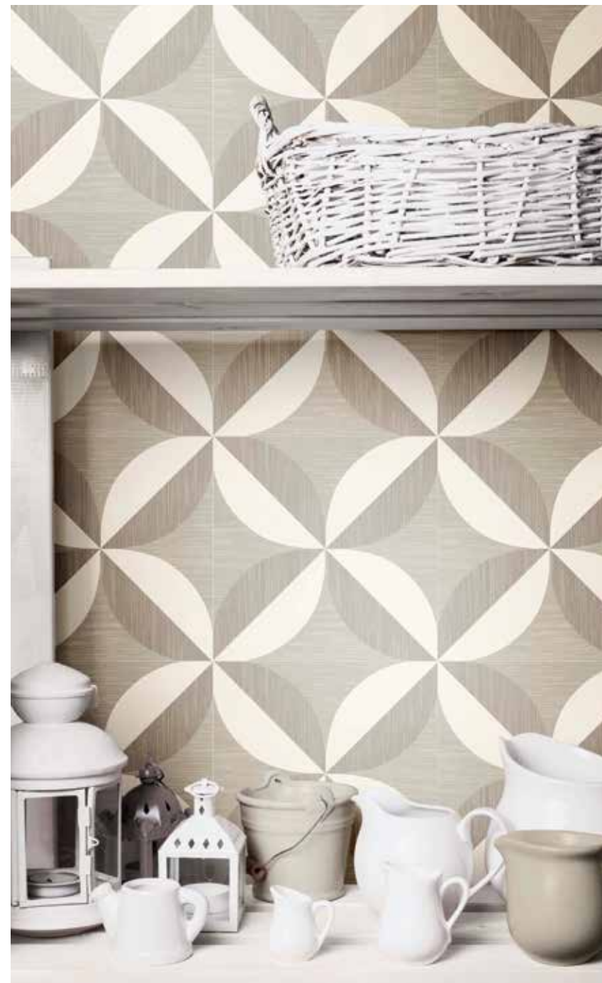
Giò #05 Tortora 20x20 cm / 8"x8"