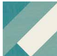
Gio #03 60x60 cm / 24"x24" Turchese