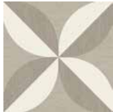
Gio #02 60x60 cm / 24"x24" Tortora