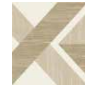
Gio #04 20x20 cm / 8"x8" Beige