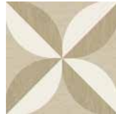
Gio #02 60x60 cm / 24"x24" Beige