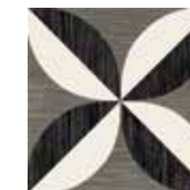
Gio #05 20x20 cm / 8"x8" Nero