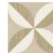
Gio #05 20x20 cm / 8"x8" Beige