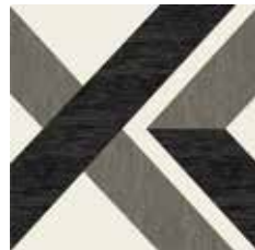
Gio #01 60x60 cm / 24"x24" Nero