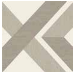
Gio #01 60x60 cm / 24"x24" Tortora