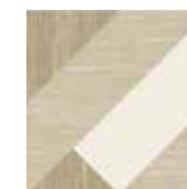
Gio #06 20x20 cm / 8"x8" Beige