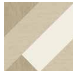
Gio #03 60x60 cm / 24"x24" Beige