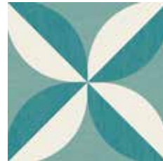
Gio #02 60x60 cm / 24"x24" Turchese