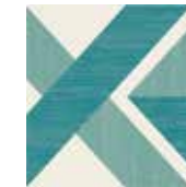
Gio #04 20x20 cm / 8"x8" Turchese