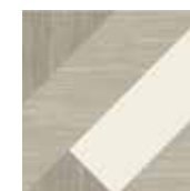
Gio #06 20x20 cm / 8"x8" Tortora