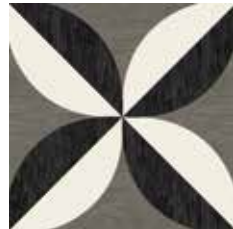
Gio #02 60x60 cm / 24"x24" Nero