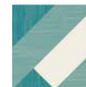
Gio #06 20x20 cm / 8"x8" Turchese