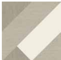
Gio #03 60x60 cm / 24"x24" Tortora