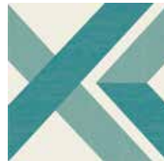
Gio #01 60x60 cm / 24"x24" Turchese