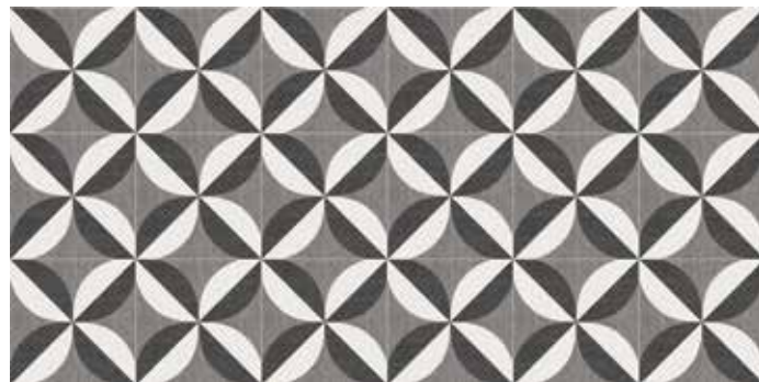
Pattern #02 60x60 cm / 24"x24" Pattern #05 20x20 cm / 8"x 8"