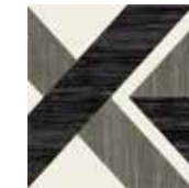
Gio #04 20x20 cm / 8"x8" Nero