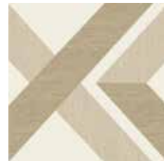
Gio #01 60x60 cm / 24"x24" Beige