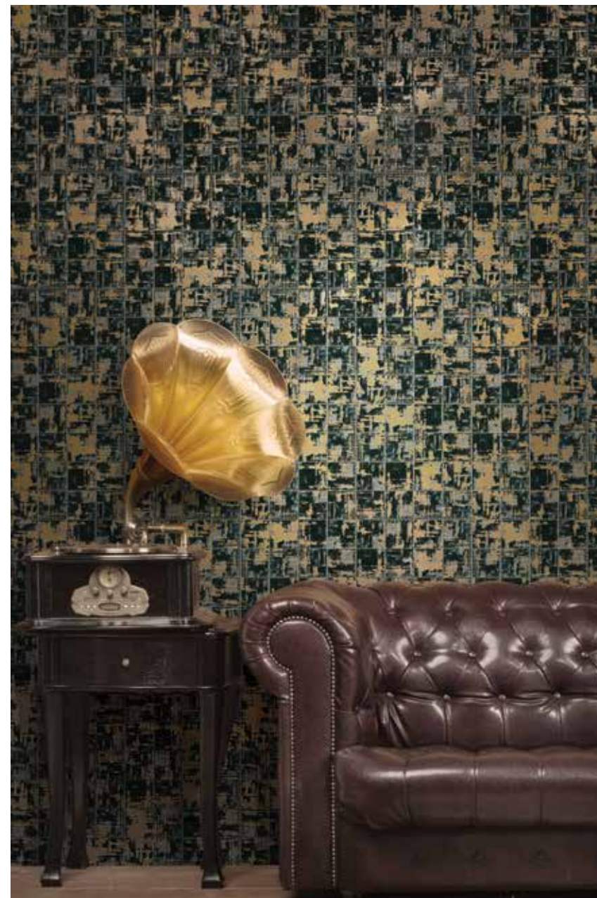
Kora Pece 29x29 cm / 11,6"x11,6"