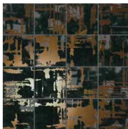
Kora Pece 29x29 cm / 11,6"x11,6"