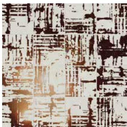
Kora Panna 29x29 cm / 11,6"x11,6"