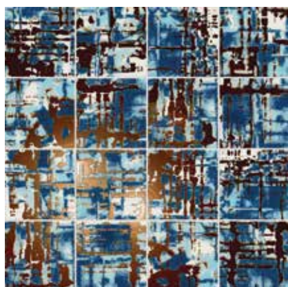
Kora Oceano 29x29 cm / 11,6"x11,6"