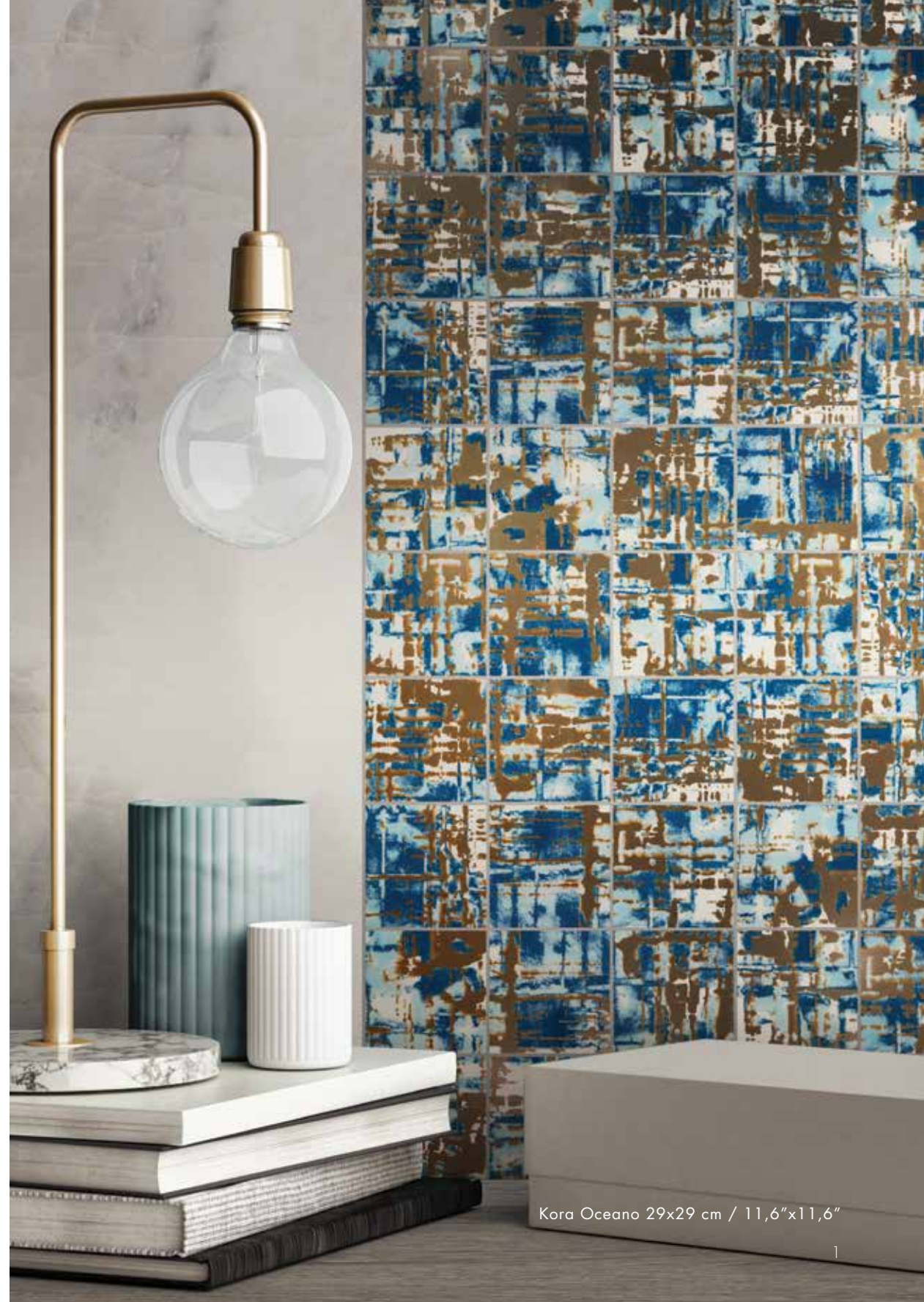
Kora Oceano 29x29 cm / 11,6"x11,6"

These are the guidelines that led to the development of the rich KORA collection. Pure sumptuous decoration that manifests itself through the overlapping of glasses and glazes which give depth to the surface. The use of gold magnificently embellishes the small square elements that form the macro mosaic mounted on a mesh with 7,1 cm (2,84"x2,84") tiles on each side. KORA, which can only be used for wall covering, is available in 3 colour variants: Panna, Pece and Oceano.