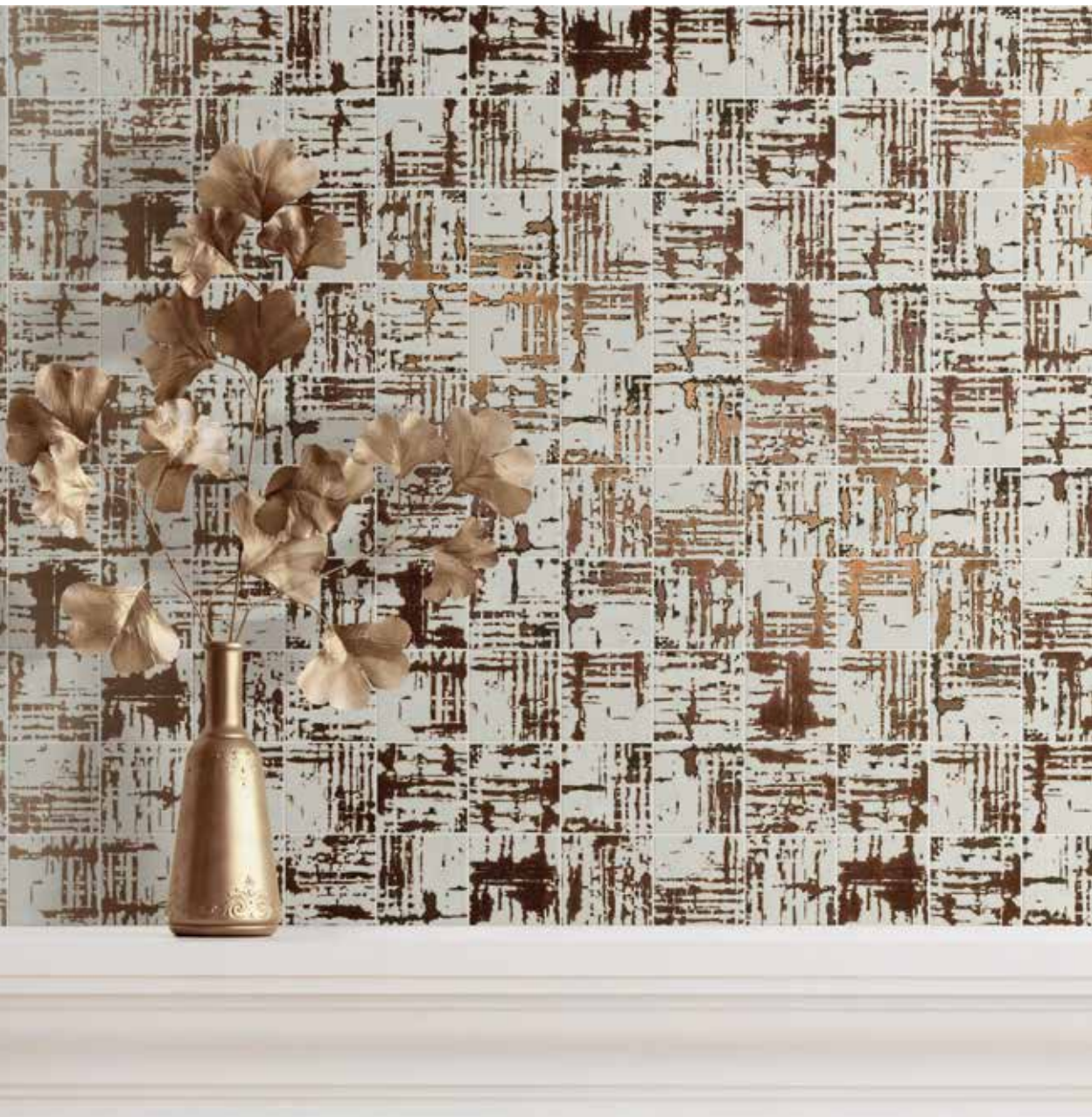
Kora Panna 29x29 cm / 11,6"x11,6"